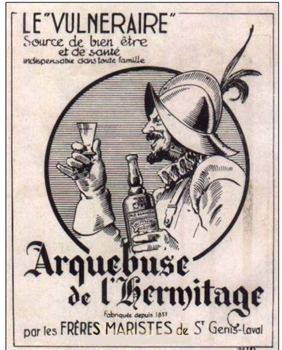
Publicité pour l'Arquebuse de l'Hermitage fabriquée par les Frères Maristes.

Je dis à la mère Moreau de nous servir également un doigt d'arquebuse. Cette distillation pharmaceutique était diaboliquement pailletée d'or et avait un arrière-goût de camphre. (Blaise Cendrars, Bourlinguer, 1948, p.312).