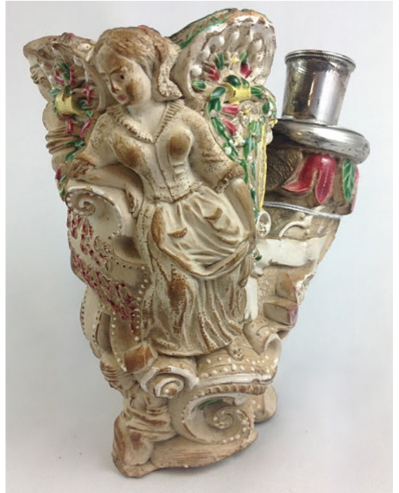
La tramasseuse. Pipe d'étalage, Exposition Nationale des produits de l'industrie agricole et manufacturière. Paris, 1848

La dentelle se fait en parcourant le pourtour de la tête avec une petite scie, & en mettant le boulon dans le fourneau ou godet de la pipe pour lui servir de soutien. Lorsque le moule porte dans son creux quelques ornements, l'ouvrier les répare à la main avec un poinçon de fer; & enlève les bavures qui auroient pu s'y former. En Hollande ce sont les filles qui font presque toutes ces dernières opérations : on leur donne le nom de tramasseuses. (Philippe Macquer; Dictionnaire raisonné universel des arts et métiers, tome 3, L'art de faire les pipes, 1773, p.466)