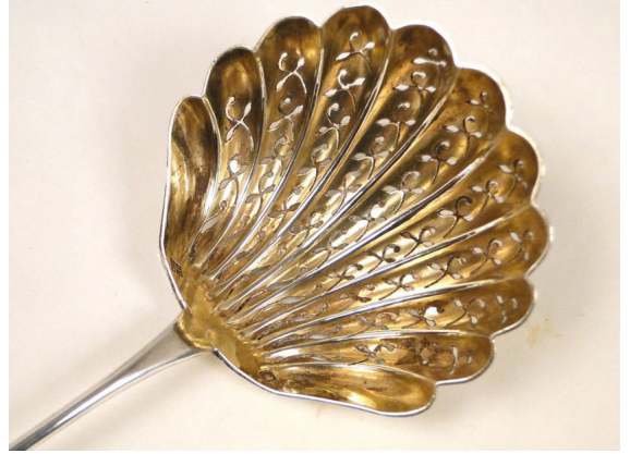
Cuillère à saupoudrer en argent massif.

De sau , variante dialectale de l'ancien français sal : sel et poudrer , du latin pŭlvĕrem , accusatif de pŭlvis : poussière, sable, poudre dont sont issus les mots savant relatifs à la poudre comme pulvériser .