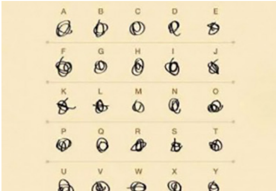
Aide pour lire une ordonnance de médecin.

L'extrémité des pattes des mouches comporte des griffes et les poils. La marche des mouches est saccadée et semble aléatoire. Si l'on trempait les extrémités des pattes d'une mouche dans de l'encre, leurs traces sur une feuille de papier ressembleraient à l'écriture désordonnée dite en « pattes de mouche » ou en « pieds de mouche ». (Wiktionnaire)