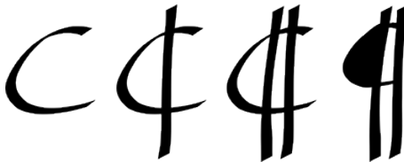
Évolution de l'abréviation de capitulum.

L'extrémité des pattes des mouches comporte des griffes et les poils. La marche des mouches est saccadée et semble aléatoire. Si l'on trempait les extrémités des pattes d'une mouche dans de l'encre, leurs traces sur une feuille de papier ressembleraient à l'écriture désordonnée dite en « pattes de mouche » ou en « pieds de mouche ». (Wiktionnaire)