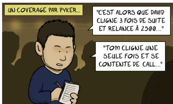
Pyker « croqué » par Dudley (clubpocker.net)

Après un brillant article relatif à la dualité du sourire, Pyker s'attaquait le mois dernier au thème de la nictation, c'est-à-dire le clignement des yeux. (clubpocker.net)