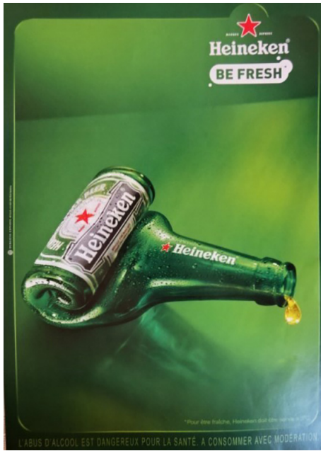
Publicité Heineken. La dernière goutte (2010)

La luxure est la goutte-mère du démonisme (Joris-Karl Huysmans, Là-bas , 1891, p.149)