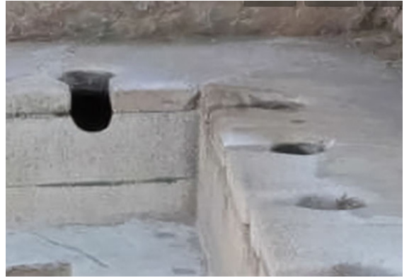
Latrines royales du château de Chambord conçues par Léonard de Vinci.

Plurale tantum : Se dit d'un nom ou d'une locution qui s'emploie uniquement au pluriel.