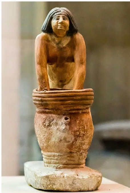
La brassreuse de bière. Musée égyptien du Caire (vers 2465 av. J.-C.)

Du latin zythum , lui-même du grec zythos : bière, qui porte aussi le nom de vin d'orge ou de boisson pélusienne, du nom de son lieu de fabrication, la ville de Péluse, située entre l'Égypte et la Palestine. Le vin d'orge avait la réputation d'être plus enivrant que le jus de raisin.