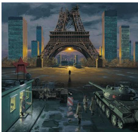
Jour J 02. Paris, secteur soviétique. Delcourt 2010

Espace et durée vécus: le « moi-ici-main-tenant »: utopie et uchronie, deux biais par lesquels nous cherchons à échapper à notre condition en nous donnant les apparences abstraites de l'éternité (Emmanuel Mounier, Traité du caractère, 1946, p. 299).