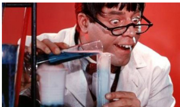
Docteur Jerry and Mister Love, un film de et avec Jerry Lewis (1963)

Quoiqu'il fit : « brum ! brum ! » tout le temps en redressant sa longue taille, au tremblement de son bras sur le mien, surtout à la pâleur insolite de son nez, un bon gros nez de savantasse, cramoiisi par l'étude et la bière de Munich, je sentais combien il était ému... (Alphonse Daudet, L'empereur aveugle, dans Contes du lundi, 1873, Fasquelle, collection Le Livre de Poche, 1974, pages 230-231.)