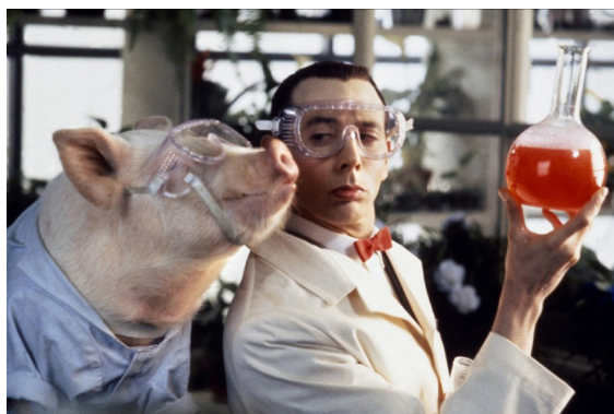
Paul Reubens dans Big Top Pee-Wee, une comédie de Randal Kleiser (1988)

Un tailleur homme du monde, ami des lettres, furieux et savantasse de musique (Edmond de Goncourt, Journal, 1854, p. 136).