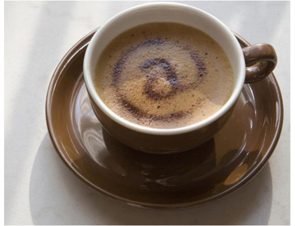
Café Collection: Paris

L'origine du symbole @ est latine. L'arobase serait tirée de la ligature de deux lettres, abréviation de l'expression latine ad signifiant vers, à, chez. L'arobase a traversé les siècles et les manuscrits pour se répandre aux États-Unis au XIX e siècle avec la signification de at : à, chez. L'arobase fut donc intégrée sur les claviers de machine-à-écrire puis ceux d'ordinateur, pour finalement devenir partie intégrante des adresses de courrier électronique en 1971.