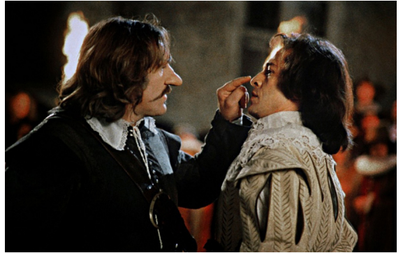
La tirade du nez dans Cyrano de Bergerac , un film de Jean-Paul Rappeneau (1990)

Du grec ancien rhis : nez, de skopein observer, examiner et du suffixe adverbial -ment , du latin mens , mentis : esprit.