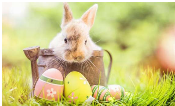
Nichet pour lapin. La ponte se fait à Pâques

Contrairement à ce que l'on pourrait croire, le nichon, très couramment employé en Normandie, n'avait rien à voir avec le terme argotique qui, depuis plus d'un siècle, désigne le sein de la femme. Il s'agit d'une variante du nichet, cet œuf factice que l'on glisse dans les nids afin d'inciter les poules à y pondre. On lui a préféré « nichon » en Normandie, « nichôt » en Flandre, « nichois » en Picardie, mais aussi « niron » en Lyonnais, « nigeot » en pays gallo, « niot » ou « nie » en Bourgogne et « naiais » dans le Maine et en Anjou. Que de noms pour un simple œuf en plâtre ! (fr:tolula.com/opinions/3565310/Le-nichon)