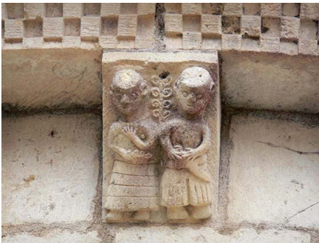
Abbaye Sainte-Marie d'Arthous, Landes (40) : modillon de l'église abbatiale. Jeunes nobles

Le jeune noble avant d'être armé chevalier n'a, d'abord, pas droit au sceau. Puis au XIII ème siècle, l'usage s'introduisit de le représenter en costume de chasse, faucon au poing ou huchet à la main (L'Histoire et ses méthodes, 1961, p.415).