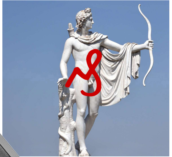
Statue d'Apollon Château de Champs-sur-Marne, Seine et Marne, 77.

Du latin deleatur : qu'il soit effacé. L'orthographe traditionnelle était deleatur , elle a été rectifiée en 1990.