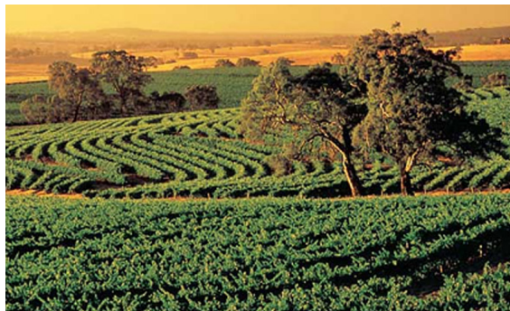
Au milieu des vignobles australiens.

Mot tiré de l'adjectif quart, quarte , servant à former des mots dont le signifié a un rapport avec quatrième ou avec quatre . On trouve la variante cartager .