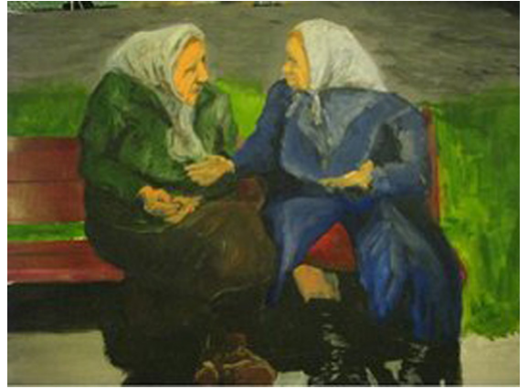
Complicité. (Huile sur toile, anonyme)

Du latin conivere , proprement cligner ensemble, du verbe coniveo : cligner ou fermer les yeux, détourner le regard.