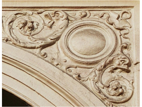
Besant. Inventaire du patrimoine architectural de la Région de Bruxelles-Capitale.