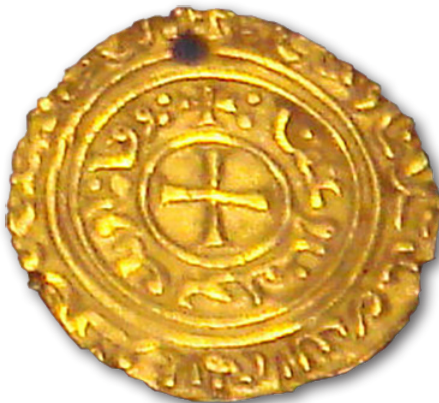
Le Besant d'or, la monnaie des croisés (1250)

Elle apportait une dot des mille et une nuits, des coffres pleins de besants d'or, d'orfèvrerie et de pierres précieuses, des tissus précieux à l'infini, (...), tout le luxe raffiné de Byzance. (René Grousset, L'Épopée des croisades, 1939, p.185).